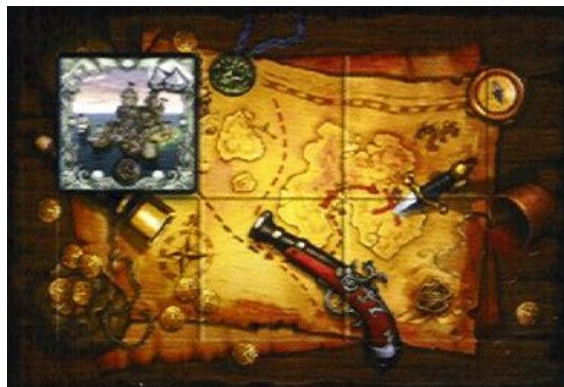
de piratentafel van Eénoog