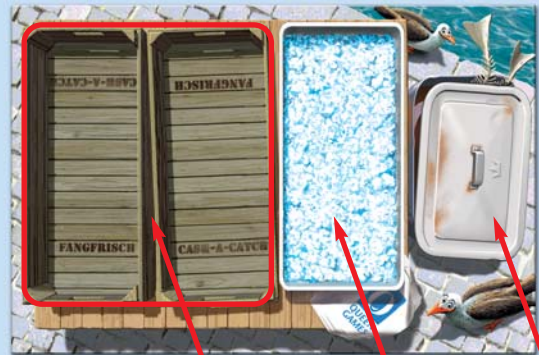
3 aflegvelden: 2 voorraadkisten en 1 koelvak afvalbalk