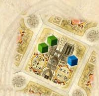
Groen = 6 prestigepunten Blauw = 3 prestigepunten

Aan het einde van iedere etappe worden prestigepunten (6/8/10/12) per steen in de Notre Dame verdeeld. Alle invloedsstenen in de Notre Dame gaan naar de algemene voorraad.